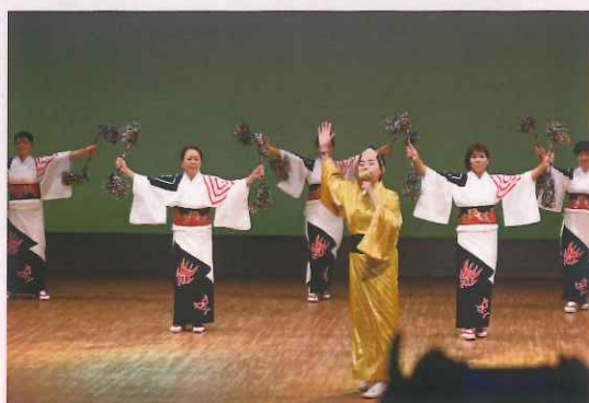
レクリエーション大会①