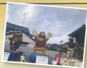
集結祭で集まった「八朔祭」つくりもの郡