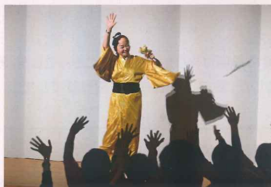
レクリエーション大会②