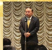
坂本衆議院議員挨拶