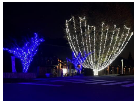
毎年恒例のイルミネーションも11月から1月の間 点灯しました