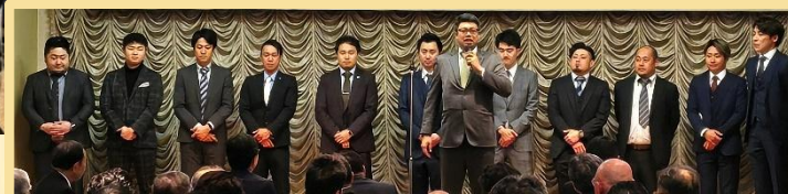
次世代を担う青年部員