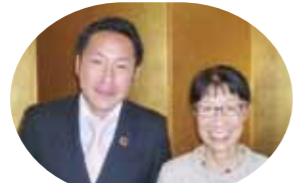
今年も合同企画頑張ります