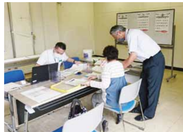
時短要請協力金の相談会

「熊本県時短要請協力金」相談会 「山都町事業継続支援給付金」申請相談窓口の開設 熊本県のまん延防止等重点措置の適用に伴い、飲食店等に対する営業時間短縮要請に全面的に協力した飲食店に協力が支給されることを受け、山都町と山都町商工会が連携して相談会を開催しました。 相談会は、6月18日と24日の両日、山都町商工会で開催され、たくさんの方の皆さんが相談に来られました。 また、「山都町事業継続支援給付金」一律10万円の給付についての相談や申請の支援も行っています。 新型コロナウイルス感染症対策については、関連の様々な給付金、協力金、補助金等がありますので、お気軽に商工会にご相談下さい。