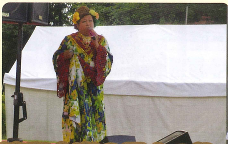
清和文楽の里まつり