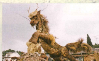
凶を廃して、吉と成す!福来(復興)麒麟 山都町に現る! 仲町上連合組