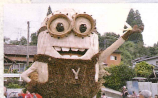
ヤベオン「元気 笑顔 平和」 矢部小学校