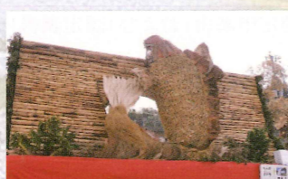
山都町にこ〜い鯉 仲町下連合組