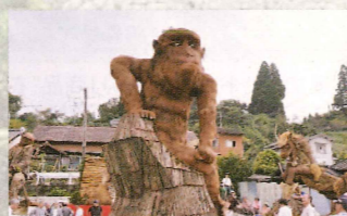
光雲(幸運)の猿(縁) 水道町・城見町・新町上連合組