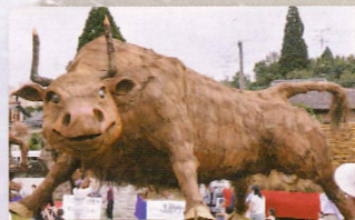
闘うしんさい(闘牛) 山都町役場