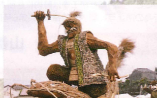
せいしょこさんのなます退治(清正公) 新町中連合組