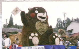
絆 ~繋ぐ未来、笑顔の熊人~ 下馬尾連合組