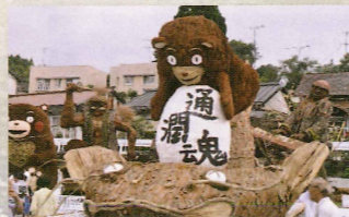
熊本は僕が守るモン 矢部高校